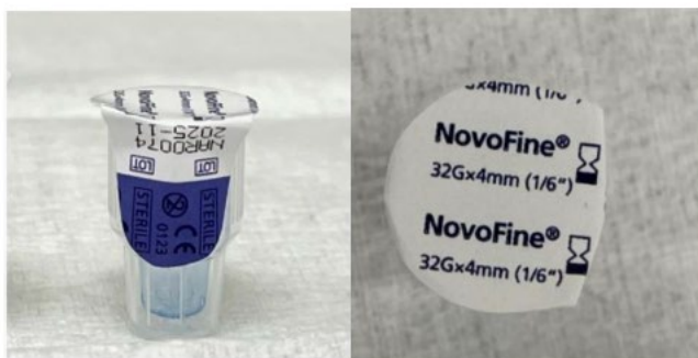
* Estas fotografías son del producto detectado en los Estados Unidos de América.