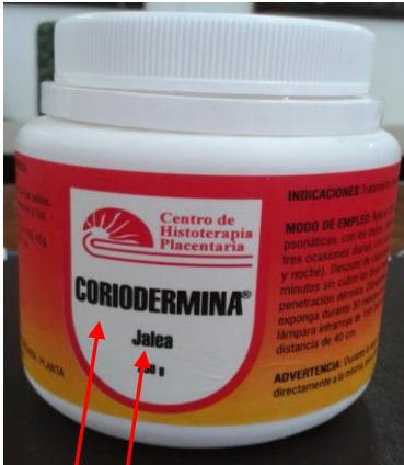
Nombre del producto y forma farmacéutica